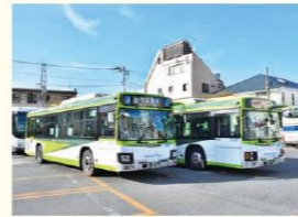
▲国際興業の路線バス

国際興業は、東京都と埼玉県で会社や学校に通う時に使用する路線バス、遠足や旅行などで使用する観光バスなど900台以上のバスを運行している運輸交通事業と、ホテルやゴルフ場などの観光レジャー事業、さまざまな商品を買っている商事流通事業、ビルやマンションなどを貸し出す不動産開発事業を行っている会社です。私たちが動く池袋営業所は、豊島区を中心に、板橋区・中野区・北区へ乗り入れる路線バスと、都心と東北地方を結ぶ高速バス、そして都内と羽田空港や成田空港をつなぐ空港連絡バスを運行しています。